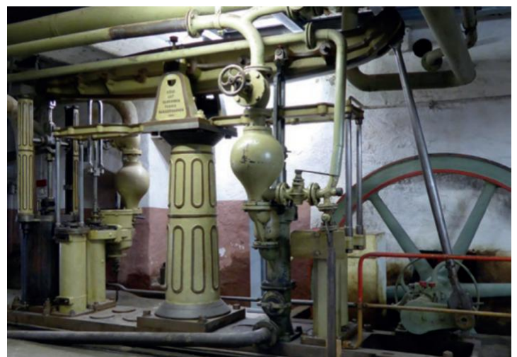
Balancierdampfmaschine von 1882

Seite "Förderverein" auf www.zuckerfabrik-oldisleben.de